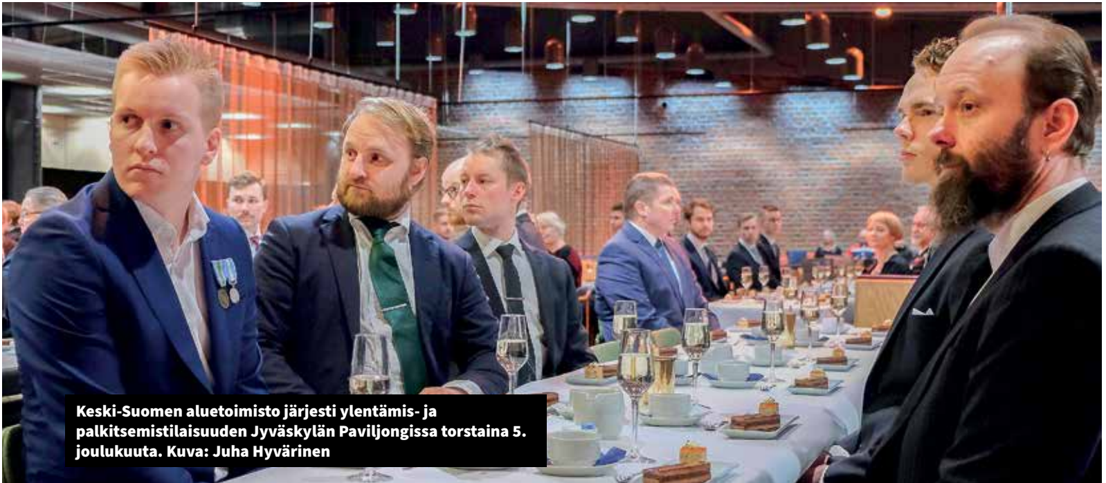
Keski-Suomen aluetoimisto järjesti ylentämis- ja palkitsemistilaisuuden Jyväskylän Paviljongissa torstaina 5. joulukuuta.