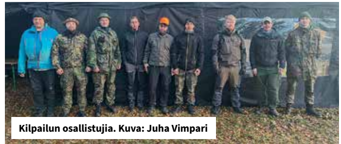
Kilpailun osallistujia.

Kokouspäivät, perhejuhlat, Nasusafarit, maailman suurin savusauna. www.tupaswilla.fi Ränssintie 5 41370 Kuusa p. 0207410100