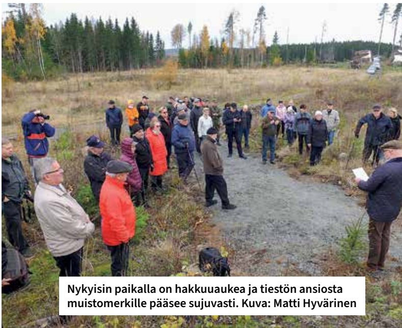
Nykyisin paikalla on hakkuuaukea ja tiestön ansiosta muistomerkillä pääsee sujuvasti.