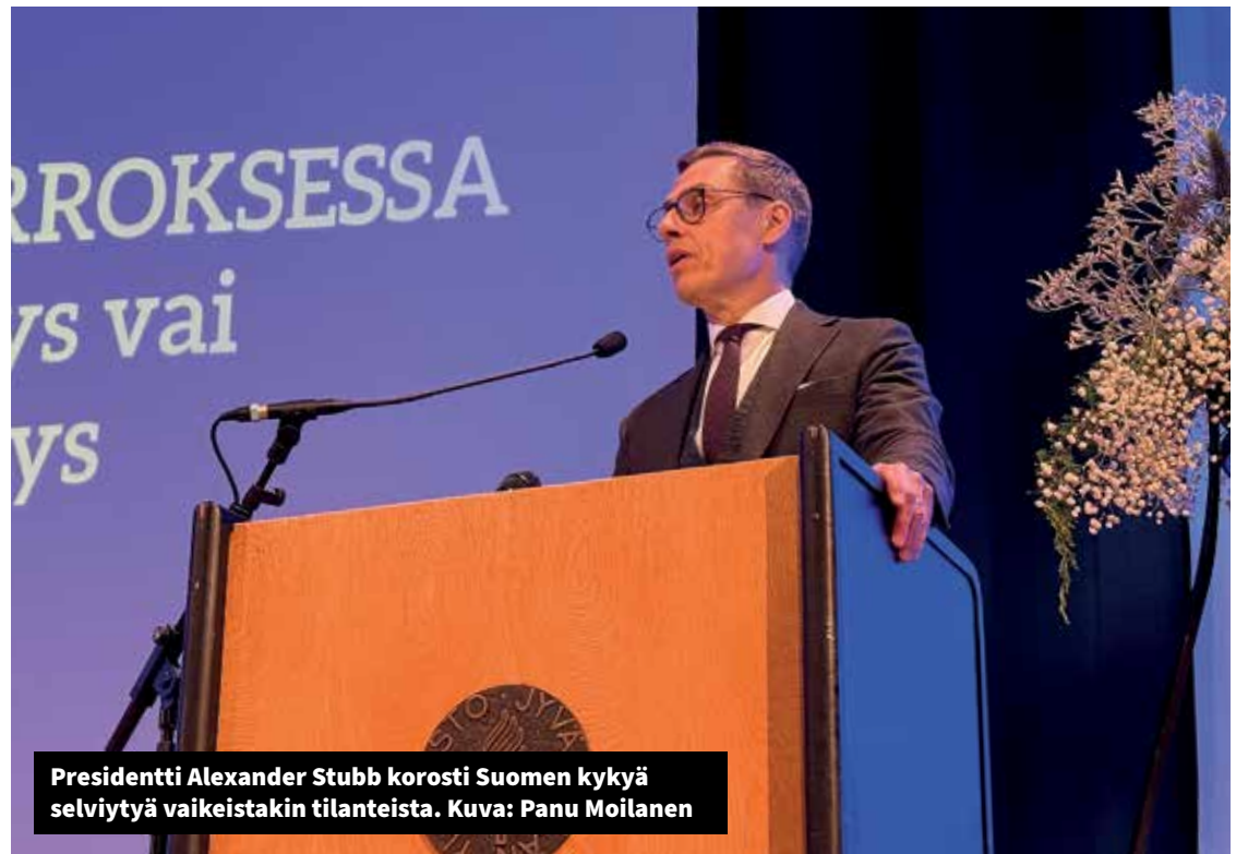
Presidentti Alexander Stubb korosti Suomen kykyä selviytyä vaikeistakin tilanteista.