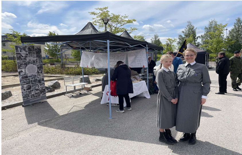
Reserviläisten ylentämis- ja palkitsemistilaisuus Jämsässä 3.6.2023.