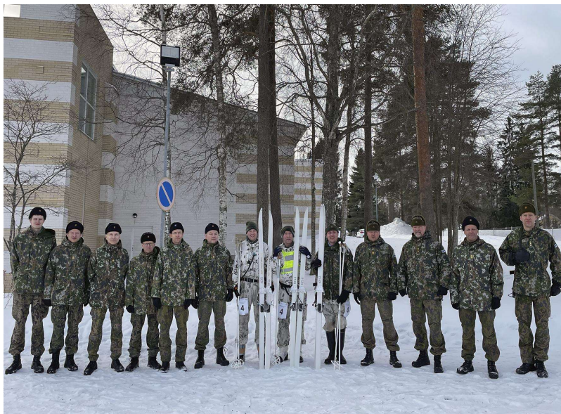
Oltermannin hiihto Siilinjärvellä 8.-10.3.2023.