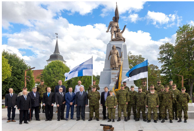
Keski-Suomen reserviläispiirin ja KL Sakala Malevin yhteistyön 20-vuotisjuhla Viljandissa 5.8.2023.