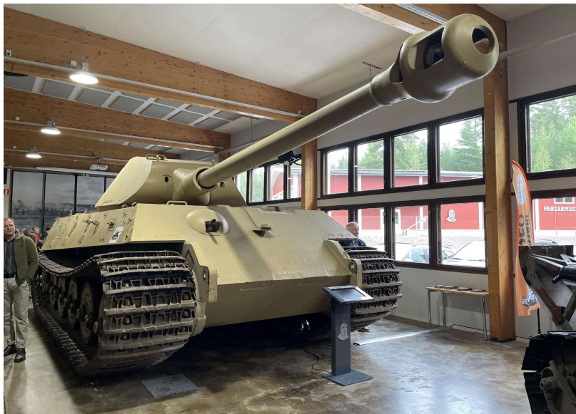
Reserviläispiiri vieraili Panssarimuseolla ja Ulkopoliittisessa insituutissa 22.8.2023. Kuvassa museon vetonaula King Tiger.