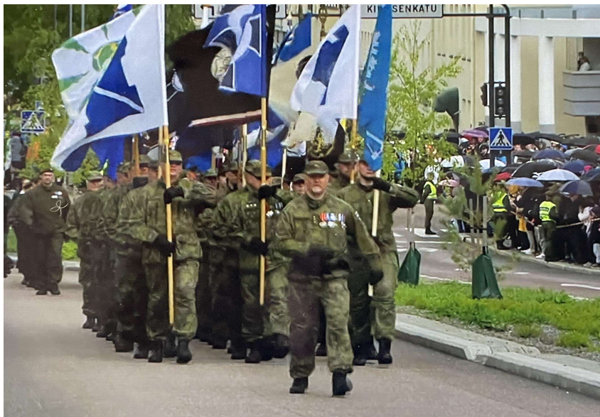
Valtakunnallinen Lippujuhlan päivän paraati Jyväskylässä 4.6.2023.